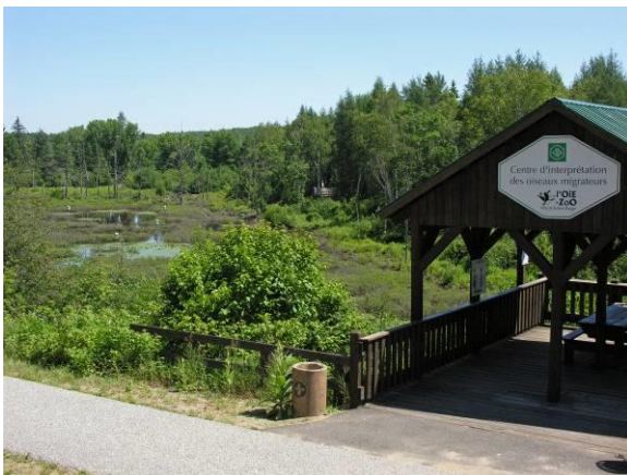
L'Oie-Zoo, belvédère sur la piste cyclable