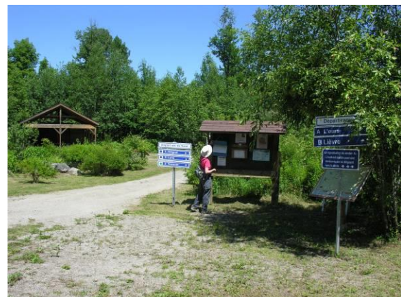
Parc écologique Le Renouveau, entrée des Marronniers