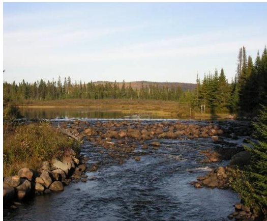
Barrage du Lac-Escalier, parc national du Mont-Tremblant © Michel Renaud

Environnement majoritairement coniférien. Observations occasionnelles de Tétràs du Canada, Mésangeai du Canada et Mésange à tête brune aux environs du ruisseau Beaulieu.