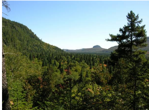
Mont La Tuque vu du sentier de la Boucle du Centenaire, parc national du Mont-Tremblant

Sentier de randonnée pédestre et de raquette. Terrain de camping de La Sablonnière et abords de la rivière du Diable intéressants (plusieurs espèces de parulines, Grand Corbeau, Petite Buse, Bec-croisé bifascié, Mésange à tête brune, Pic à dos noir, Mésangeai du Canada).