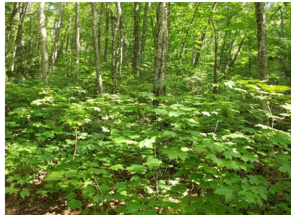
Érablière à bouleau jaune