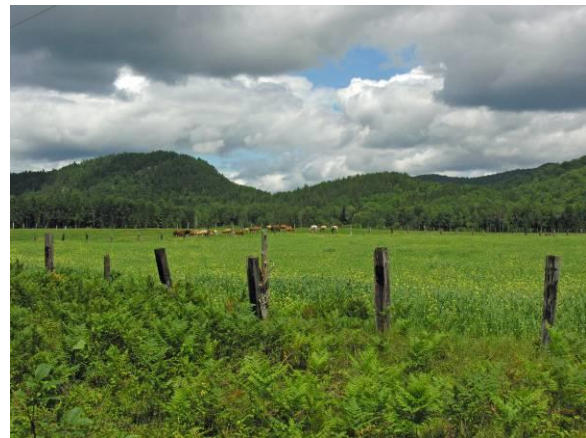
Parc linéaire Le P'tit Train du Nord, La Conception

Accès par Labelle : gare de Labelle, rue du Dépôt.