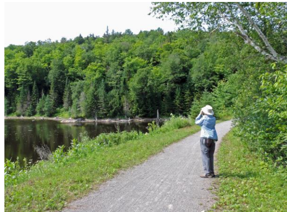
Corridor Aérobie, Wentworth-Nord