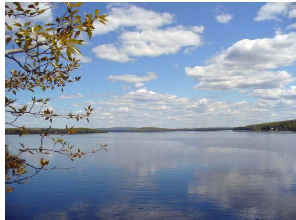
Grand lac Nominique