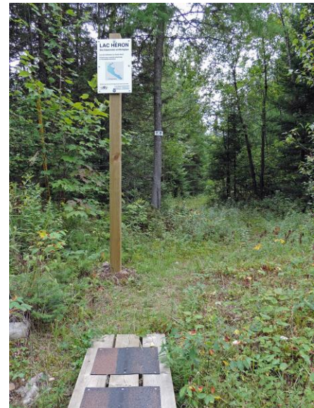
Lac Héron, Signalisation