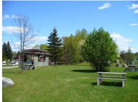
Nominique, la Gare