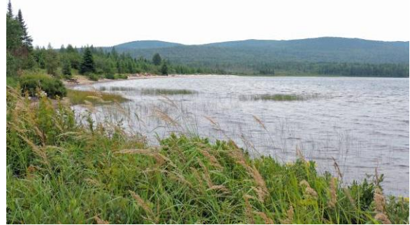
Lac des Sables, parc national du Mont-Tremblant

Aux environs du ruisseau Beaulieu, environnement majoritairement coniférien : observations occasionnelles de Tétràs du Canada, Mésangeai du Canada et Mésange à tête brune.