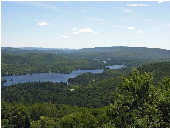
Point de vue, sentier de L'Envol

Sentier de randonnée pédestre et de raquette. Érablière à bouleau jaune et îlots conifériens (Parulines bleue, à gorge noire, à tête cendrée et couronnée; Grive solitaire, Viréo à tête bleue, Sittelle à poitrine rousse; Pic à dos noir et mésange à tête brune occasionnels).