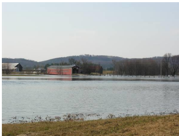
Crue printanière au pont Prud'homme, Mont-Tremblant

Printemps : au moment de la crue et de la migration des canards (Bernache du Canada; Canards branchu, noir, colvert, d'Amérique, souchet et pilet; Petit Garrot, Fuligule à collier, Sarcelle d'hiver; Pluvier kildir, Grand Chevalier, Chevalier solitaire, Busard Saint-Martin; Grue du Canada occasionnelle).