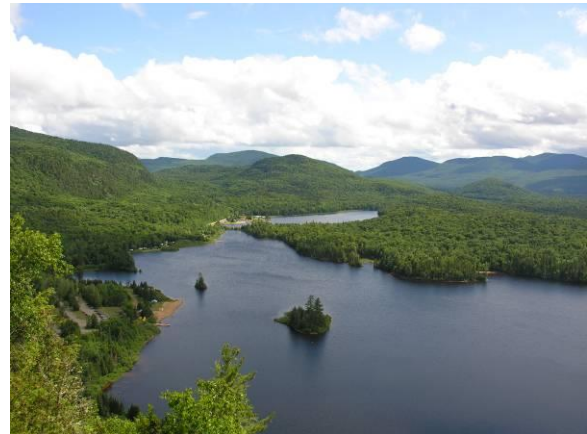
Lac Monroe vu du belvédère de la Corniche

Centre de découverte (liste détaillée des oiseaux disponible), stationnements, toilettes, aires de pique-nique. Liste sommaire des oiseaux : http://tinyurl.com/Oiseaux-PNMT