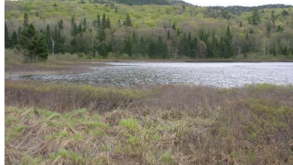
Lac Chat, sentier du Lac-aux-Atocas

Ouvert du printemps aux premières neiges. Milieux aquatiques entourés de forêt mixte et de buissons (plusieurs espèces de parulines dont Parulines flamboyante, à collier, masquée, à tête cendrée; Grive solitaire, Plongeon huard, Grand Harle, Grand Héron, Martin-pêcheur d'Amérique, Moucherolles des aulnes et pébi, Bec-croisé bifascié).