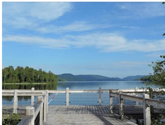
Observatoire d'oiseaux du lac Tremblant

Périodes d'observation : Mai et juin, septembre à novembre. Site à fréquenter tôt le matin, avant que les environs du centre de villégiature s'animent.