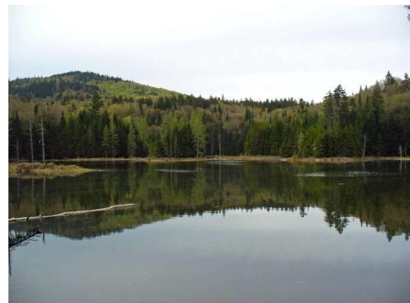
Lac des Femmes

Ouvert à l'année (raquette en hiver). Érablière à bouleau jaune, forêt mixte, petit lac en milieu forestier (plusieurs espèces de parulines dont Parulines bleue, à gorge noire, couronnée, à croupion jaune; Viréos aux yeux rouges et à tête bleue; Sittelle à poitrine rousse, Troglodyte des forêts, Hirondelle bicolore, Grand Harle, Harle couronné, Gélinotte huppée, Grand Pic, Grives solitaire et fauve, Grimpereau brun, Junco ardoisé).