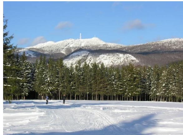
Mont Tremblant vu du domaine Saint-Bernard

Mai à juillet (Merlebleu de l'Est, Hirondelle bicolore, Viréo à tête bleue, Grand Corbeau, Grive solitaire, Troglodyte des forêts, Bruant à gorge blanche; plusieurs espèces de parulines dont Parulines bleue, à gorge noire, à croupion jaune, à tête cendrée, couronnée).