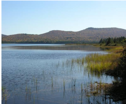
Lac Escalier, parc national du Mont-tremblant

Secteur de la Diable (via Lac-Supérieur). Entrée du parc : au bout du chemin du Lac-Supérieur, Lac-Supérieur. Après la guérite, continuer sur la route 1, puis tourner à droite sur la route 19 (environ 25 km après la guérite).