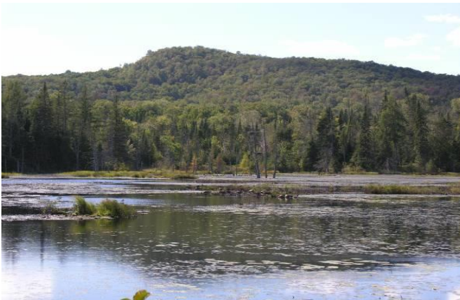
Lac Héron, Mont-Tremblant