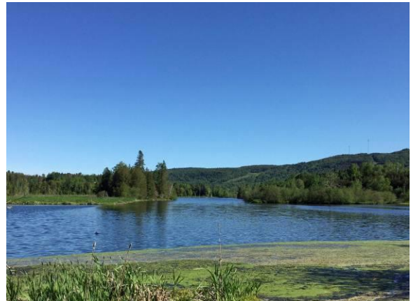
Sentier des Étangs, Saint-Donat

Site intéressant pour les oiseaux d'hiver, diversité variable selon les années (Mésange à tête noire, Sittelle à poitrine rousse, Gros-bec errant, Tarin des pins, Sizerin flammé, Chardonneret jaune, Bec-croisé bifascié).