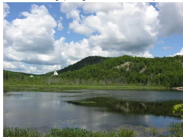
Lac aux Rats et parois du mont Larose, Montcalm © Michel Renaud

Forêt mixte et érablière (plusieurs parulines dont Parulines noir et blanc, à flancs marron, du Canada, flamboyante, à gorge orangée et couronnée; Roselin pourpré, Viréo aux yeux rouges, Pic maculé, Cardinal à poitrine rose, Grand Corbeau, Urubu à tête rouge; Faucon pèlerin).