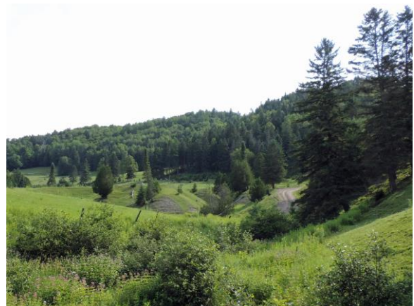
Huberdeau (Gray Valley)