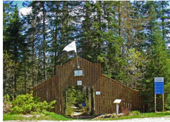
Entrée du boisé Joseph-B.B.-Gauthier