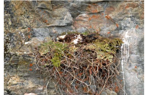
Aigle royal au nid

Admission : membres 5 $ – non-membres 8 $