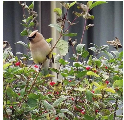
Jaseur d'Amérique © Ginette Lagacé

Admission : membres 5 $ – non-membres 8 $