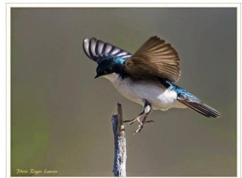
Hirondelle bicolore

Admission : membres 5 $ – non-membres 8 $