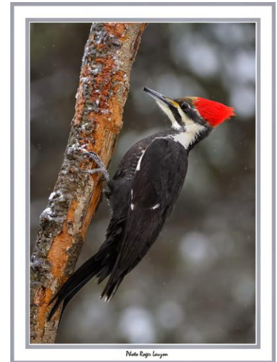
Grand Pic femelle

Admission : membres 5 $ – non-membres 8 $