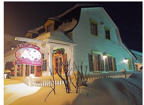
Restaurant des petits ventres

Restaurant des Petits Ventres 839 rue de Saint-Jovite, Mont-Tremblant