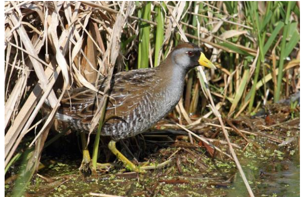
Marouette de Caroline

Admission : membres 2 $ – non-membres 5 $