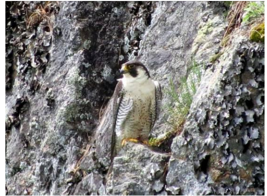
Faucon pèlerin

Afin de mieux connaître le Faucon pèlerin aux escarpements de Piedmont-Prévost, quelques bénévoles regroupés sous le nom de la Vigie 2016 ont entrepris un suivi serré des faits et gestes de cet oiseau mythique en période de nidification. De mars à décembre 2016, plus de 350 heures d'observation ont été investies dans ce projet quelque peu particulier.