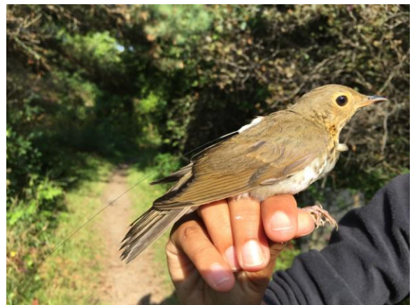
Grive à dos olive avec émetteur

Admission : membres 5 $ – non-membres 8 $