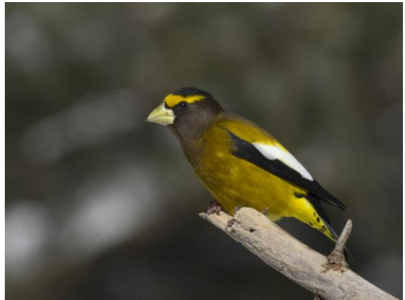
Gros-bec errant

Admission : membres 5 $ – non-membres 8 $