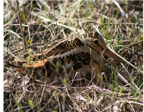
Bécasse d'Amérique

Admission : membres 5 $ – non-membres 8 $