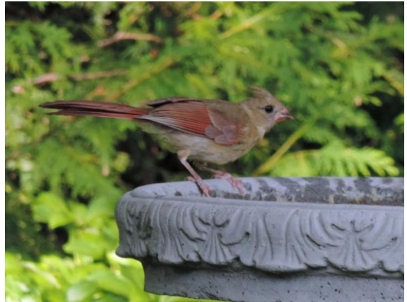
Cardinal rouge juvénile

Admission : membres 2 $ – non-membres 5 $