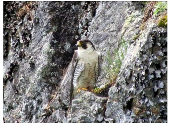
Faucon pèlerin

Afin de mieux connaître le Faucon pèlerin aux escarpements de Piedmont-Prévost, quelques bénévoles regroupés sous le nom de la Vigie 2016 ont entrepris un suivi serré des faits et gestes de cet oiseau mythique en période de nidification. De mars à décembre 2016, plus de 350 heures d'observation ont été investies dans ce projet quelque peu particulier.