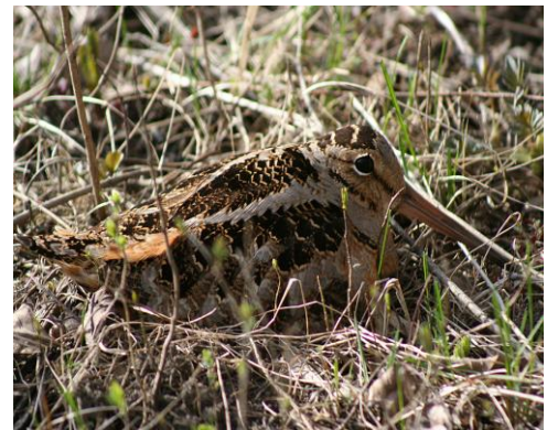
Bécasse d'Amérique

Admission : membres 5 $ – non-membres 8 $