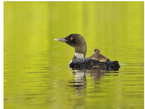
Plongeon huard et huard

Admission : membres 5 $ – non-membres 8 $